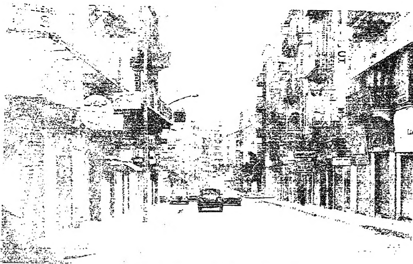
■ شارع وهران .. محلات مقلدة عدد محدود من السيارات